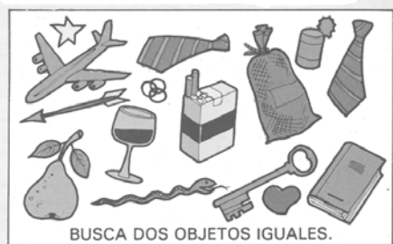
BUSCA DOS OBJETOS IGUALES.

De nosotros depende que las noches y los días sean buenos o no lo sean.